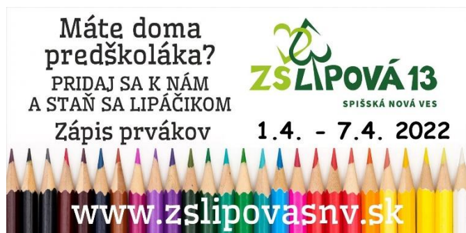
Obr. 4 Banner k zápisu