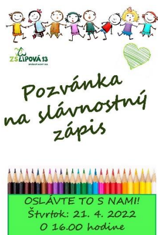
Obr. 6 Pozvánka k slávnostnému zápisu