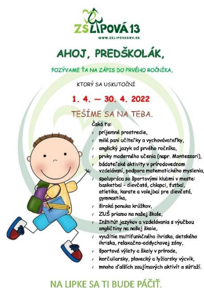
Obr. 7 Informačný leták do MŠ