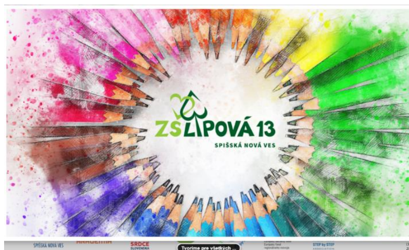
Obr. 3 Leták s informáciami o škole